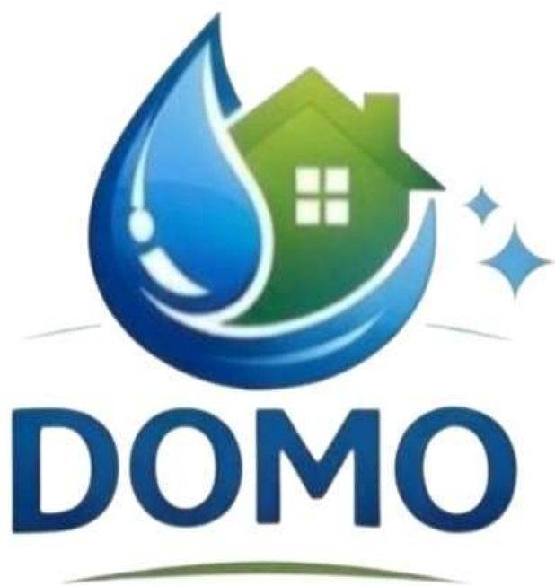
Depuratore Osmosi inversa